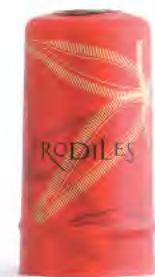
Diseño por serigrafía