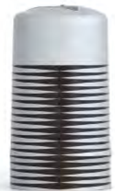
Barnices: sobre el estaño o sobre color