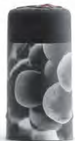
Decoraciones con hasta 6 colores casados en la falda